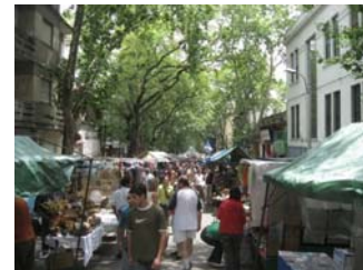
Feria de Tristán Narvaja